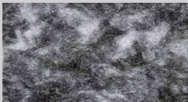
ECO SKIN: tessuto non tessuto compatto