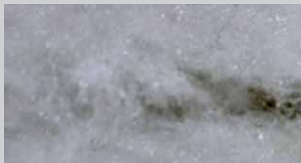
Convenzionale tessuto non tessuto a strati