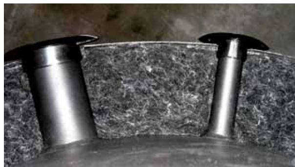
Perfetta adattabilità e quindi nessun "effetto camino"

Gli ingegneri della Austria Email AG hanno sviluppato un procedimento di produzione speciale per ECO SKIN 2.0 per aumentare al massimo l'efficacia dell'isolamento termico.