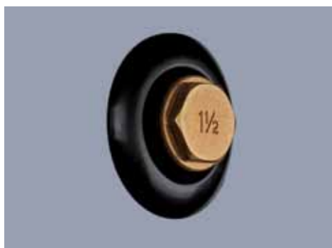
Collegamento al riscaldamento senza calotta

Le immagini a raggi infrarossi rivelano un isolamento termico notevolmente ottimizzato nella zona dei collegamenti