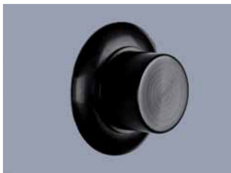
Collegamento al riscaldamento con calotta