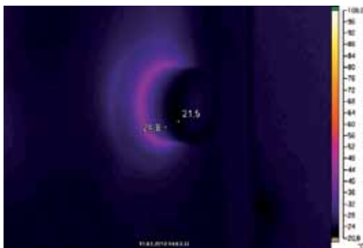
Immagine a raggi infrarossi con calotta